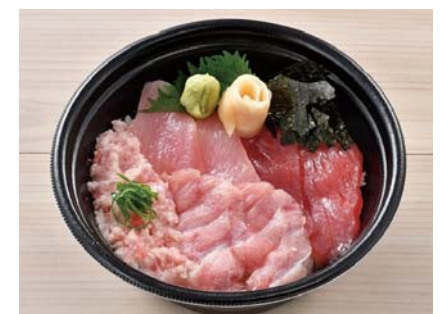
■ まぐろハラモとまぐろたたきたくあん丼 / まぐろハラモとろろ丼 / まぐろ四色丼