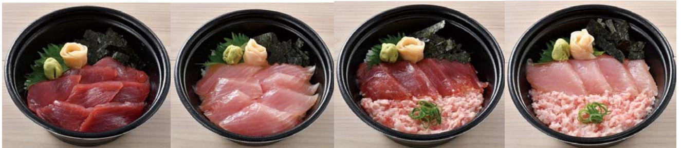
■ 赤鉄火丼 / 白鉄火丼