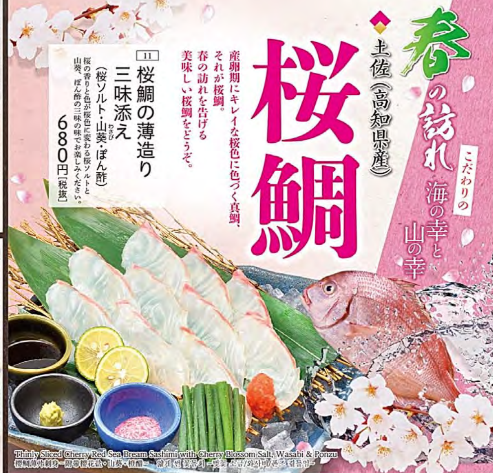
Thinly Sliced Cherry Red Sea Bream Sashimi with Cherry Blossom Salt, Wasabi & Ponzu 桜鯛刺身おろし梅おろしぽん酢(山菜、桜鯛) 鶏卵(卵黄) 醤油(醤油)와 자메이산(산채) 요리

産卵期にキレイな桜色に色づく真鯛、 それが桜鯛。 春の訪れを告げる 美味しい桜鯛をどうぞ。