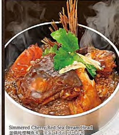
Simmered Cherry Red Sea Bream Head 釜鍋焼鯛魚頭 鶏卵 대파리 과 마늘 요리

41 桜鯛のねぎレモン ペッパー焼 780円(税抜) ※ソースにお酒を使用している為、お子様や お車を運転される方は注意ください。