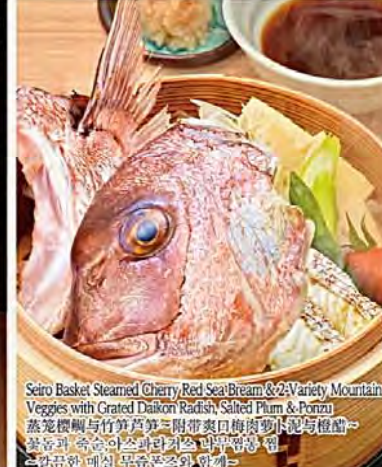
Seiro Basket Steamed Cherry Red Sea Bream & 2-Variety Mountain Veggies with Grated Daikon Radish, Salted Plum & Ponzu 蒸籠鰻鯛と竹筍第3附帯奥山梅肉野菜と写梅醋 山菜와 육송이 스테이크 요리 산채와 육송이 스테이크 요리