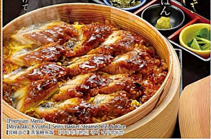
(Premium Menu) [Miyazaki, Kyushu] Seiro Basket Steamed Eel & Rice [宮崎県産] 蒸籠鰻魚飯 [アレルギー] 鶏卵 小麦粉 醤油