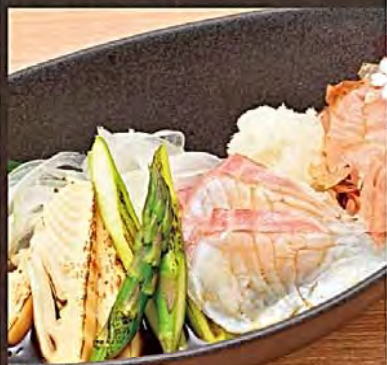
Grilled Cherry Red Sea Bream & 2-Variety Mountain Veggies in Sauce 桜鯛と山菜の山菜煮 桜鯛と山菜の山菜煮(山菜、桜鯛) 산채와 육송이 스테이크 요리 산채와 육송이 스테이크 요리

12 アスパラ、筍の山の幸とともにどうぞ。 桜鯛と山の幸二種の 炙り焼きびたし 480円(税抜)