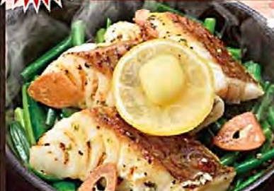
Lemon Pepper Grilled Cherry Red Sea Bream with Leek 香葱柠檬胡椒櫻鯛鉄板焼 鶏卵 과 레몬 껍질 구이

20% OFF クーポン 対象商品! [20%OFFクーポンについて] ※下記のいずれかをお会計時にご提示ください。 ●エポスカード会員限定クーポンを持参 (お会計はエポスカード払いが条件) ●当社モバイル会員限定メルマガクーポンご提示 ●当社SNS公式アカウントクーポンご提示 [対象の当社SNS 公式アカウントクーポン] LINE@