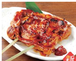
白木屋ジャンボ焼鶏