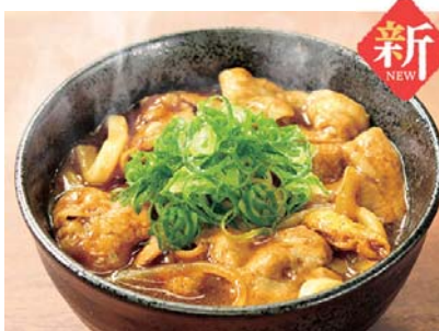
イベリコ豚のスパイシー カレーうどん