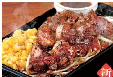
鉄板！牛カットステーキ ～シャリアピンソース～