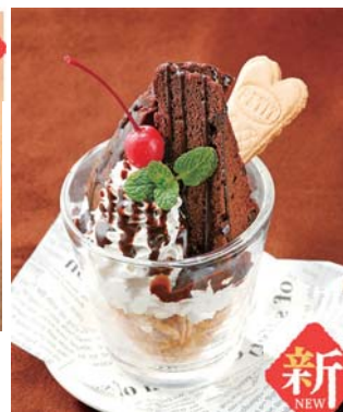
濃厚ガトーショコラの グラスパフェ