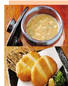
(商品例) 山内農場のなめ味噌とつけあげセット

当社店舗のプライベートブランド商品や「おせち3段重」、有機野菜、馬刺し食べ比べセット、越後の米農家直送新潟米、一味違う栗醤油、信州の味噌屋が送るトマト味噌、養鶏場からは「卵」や「プリン」、お茶専門店、下関からお届けする「のどぐろ」「あんこうの“い”」の加工品など、こだわりの食品を取り揃えています。