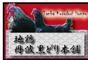
地鶏丹波黒どり本舗