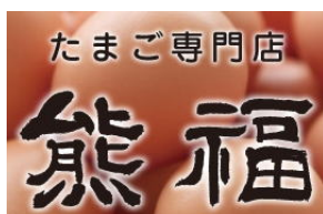
たまご専門店熊福