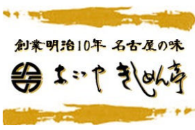
なごやきしめん亭