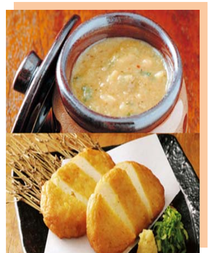
商品例：山内農場のなめ味噌とつけあげセット

当社は、これからもお客様の様々なニーズに柔軟に対応し、美味しい食材を、もっと身近に楽しんでいただける魅力的なサービスの提供に取り組みます。