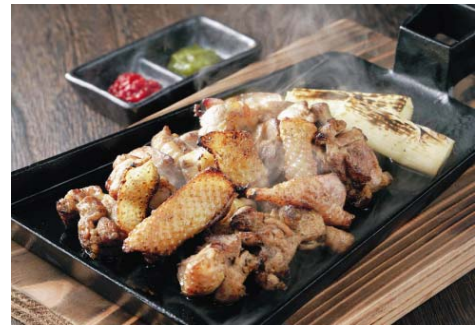
(料理画像はイメージです)

(※) 農林物資の規格化及び品質表示の適正化に関する法律 (JAS 法) に基づく、品質保証の規格。