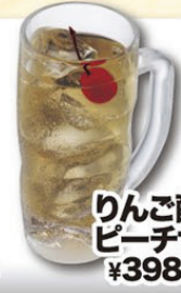
りんご酢 ピーチサワー ¥398(税込¥418)