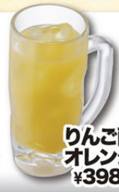
りんご酢 オレンジハイ ¥398(税込¥418)