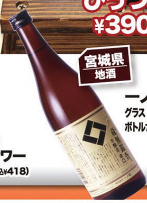
宮城県 地酒 一ノ蔵 グラス ¥480(税込¥504) ボトル720ml ¥1,980(税込¥2,079)