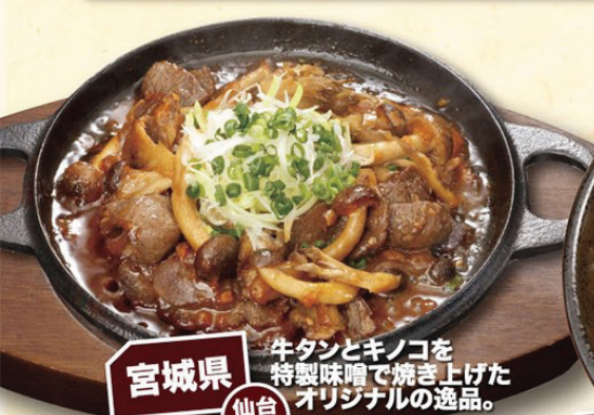
宮城県 仙台名物 牛タンとキノコを 特製味噌で焼き上げた オリジナルの逸品。 キノコと牛タンの 特製味噌鉄板焼き ¥580(税込¥609)