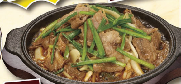
岩手県 新鮮なラムとたっぷり野菜を スタミナダレで召し上がれ!! ラムともやしのスタミナ炒め ¥480(税込¥504)