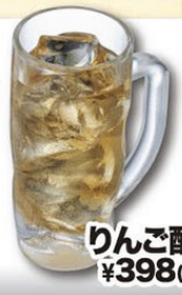
りんご酢サワー ¥398(税込¥418)