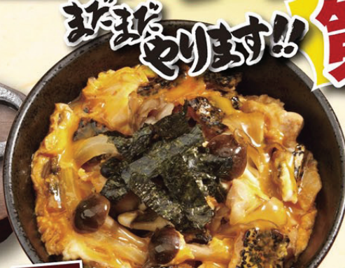
青森県 青森県の南部せんべいを丼にした モンテローザオリジナルの逸品。 南部せんべい丼 ¥390(税込¥410)