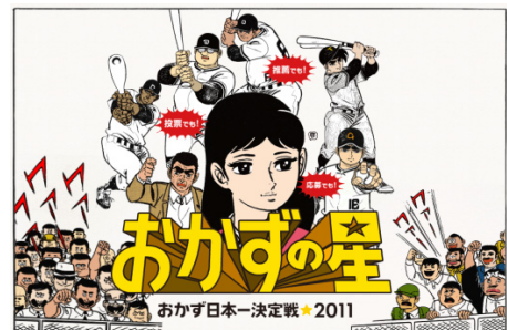
(c)梶原一騎・川崎のぼる／講談社 Copyright (c) MONTEROZA, Inc All Rights Reserved.

そのような中、当社はこのコンテストで、居酒屋を利用する・しないに関係なく皆様に参加していただき、皆様を盛り上げ、そして外食・内食関係なく「食」全体を盛り上げたいと考えています。